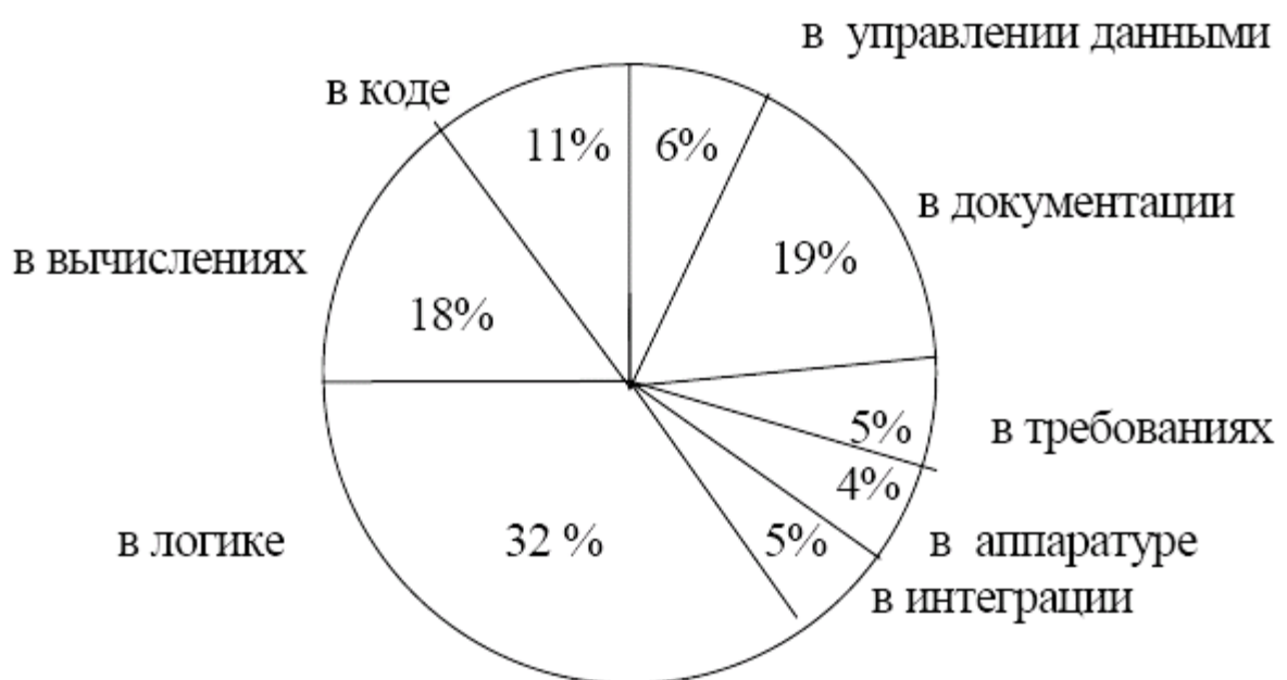
Рисунок 1. Процентное соотношение ошибок при разработке ПО

Исследования фирм IBM показали, чем позже обнаруживается ошибка в программе, тем дороже обходится ее исправление, эта зависимость близка к экспоненциальной. Так военно-воздушные силы США оценили стоимость разработки одной инструкции в 75 долларов, а ее стоимость сопровождения составляет около 4000 долларов.