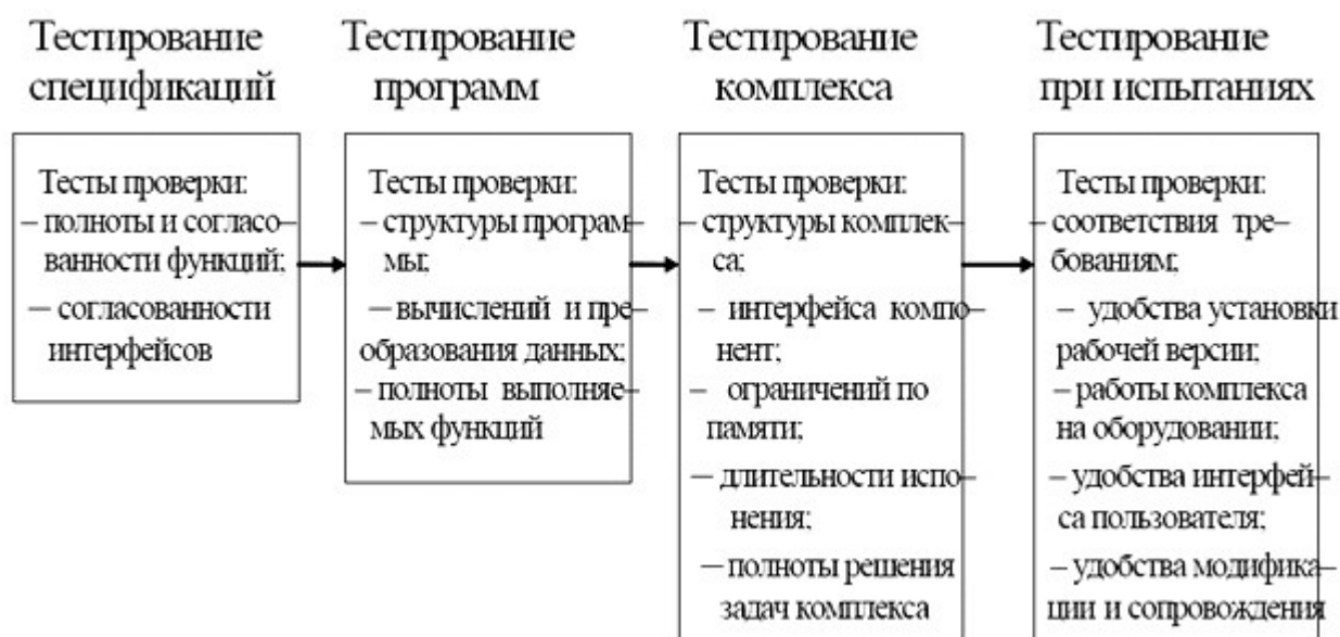
Рисунок 2. Классификация тестов проверки

Многие типы тестов готовятся заказчиком для проверки работы программной системы. Структура и содержание тестов зависят от вида тестируемого элемента, которым может быть модуль, компонент, группа компонентов, подсистема или система. Некоторые тесты зависят от цели и необходимости знать: работает ли система в соответствии с ее проектом, удовлетворены ли требования и участвует ли заказчик в проверке работы тестов и т.п.